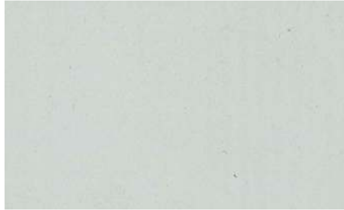
RAL 7035 gofrato