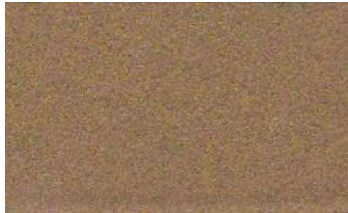
Bronzo Antico gofrato